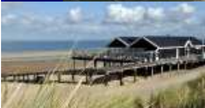
Renesse "our seaside"