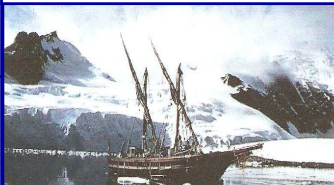
De S. Giuseppe in Antarctica